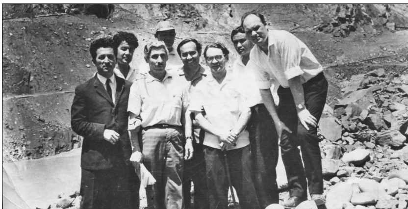
Язучылар белән. Нарәк шәһәре, Тажикстан. 1969 ел.