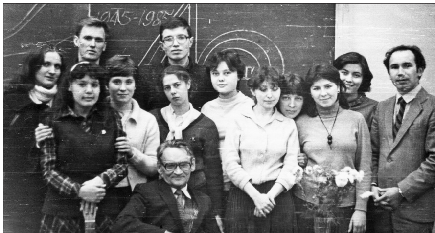
Казан дәүләт университетының журналистика бүлеге студентлары белән. Казан, 1984 ел.