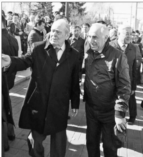
ТРның Дəүлэт Киңəшчесе Минтимер Шəймиев Исмехан Госманлы белəн Тукай хайкəле янында.

Əмма кечкенədən төрки халыкларның тарихы хэм мэдəнияте белəн кызыксынган егет буш вакыт булуга, китапханэлəргə барып, үзлектэн борыңгы төрки теллэрне, урта гасырлар төрки мэдəниятен өйрəнү белəн шөгьльлənə.